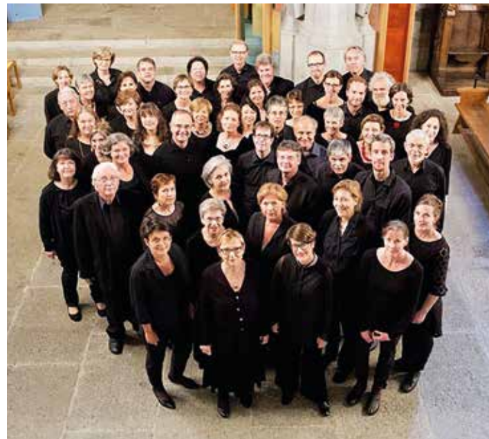
Chœur de la Cité, Lausanne