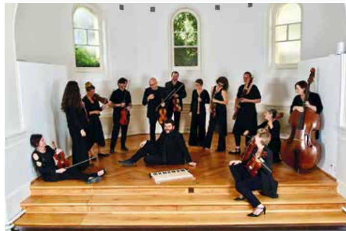
Orchestre Le Moment Baroque

Le Moment Baroque est un ensemble spécialisé dans l'interprétation sur instruments d'époque des musiques baroque et classique. Il rassemble des musiciens professionnels de larges horizons musicaux et géographiques autour d'une recherche artistique commune faite de curiosité, de passion et d'une grande exigence musicale. Il se produit tant en formation de musique de chambre que dans un effectif de type orchestral.