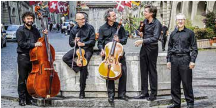
Ensemble I Salonisti

Enfin, pour perpétuer la tradition, le public est invité à proposer lui-même les deux pièces qui cloront le programme, avant le non moins traditionnel verre de Mauler, généreusement offert par nos amis du Prieuré de Môtiers.