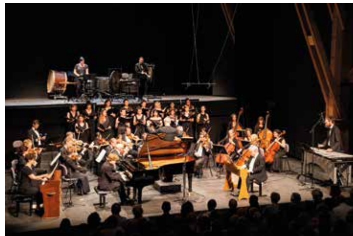
Orchestre des Jardins Musicaux

L'œuvre sera suivie des fameuses Petites liturgies de la présence divine de Messiaen, l'une des partitions les plus achevées du compositeur, écrite durant la seconde guerre mondiale et présentée en première audition en 1945. Le meilleur de Messiaen se retrouve dans cette œuvre saisissante et d'une profonde poésie, dont l'auteur a pris soin d'écrire lui-même le texte, chanté par trente-six voix féminines à l'unisson.