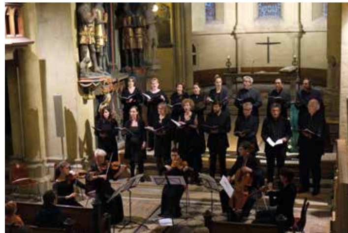
Ensemble vocal de la Collégiale

Quant au second concerto brandebourgeois, il s'agit dans les faits d'un véritable concerto pour trompette, aussi brillant qu'exigeant. Bach, qui devait connaître un exécutant absolument hors pair, pousse ici l'instrument à ses limites absolues, au service d'un discours festif et flamboyant.